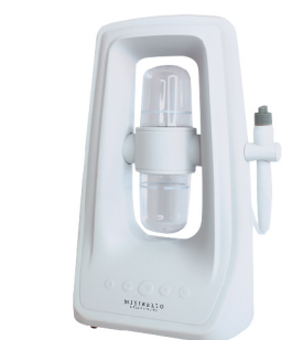
ハイドロスプラッシュ (本体一式)